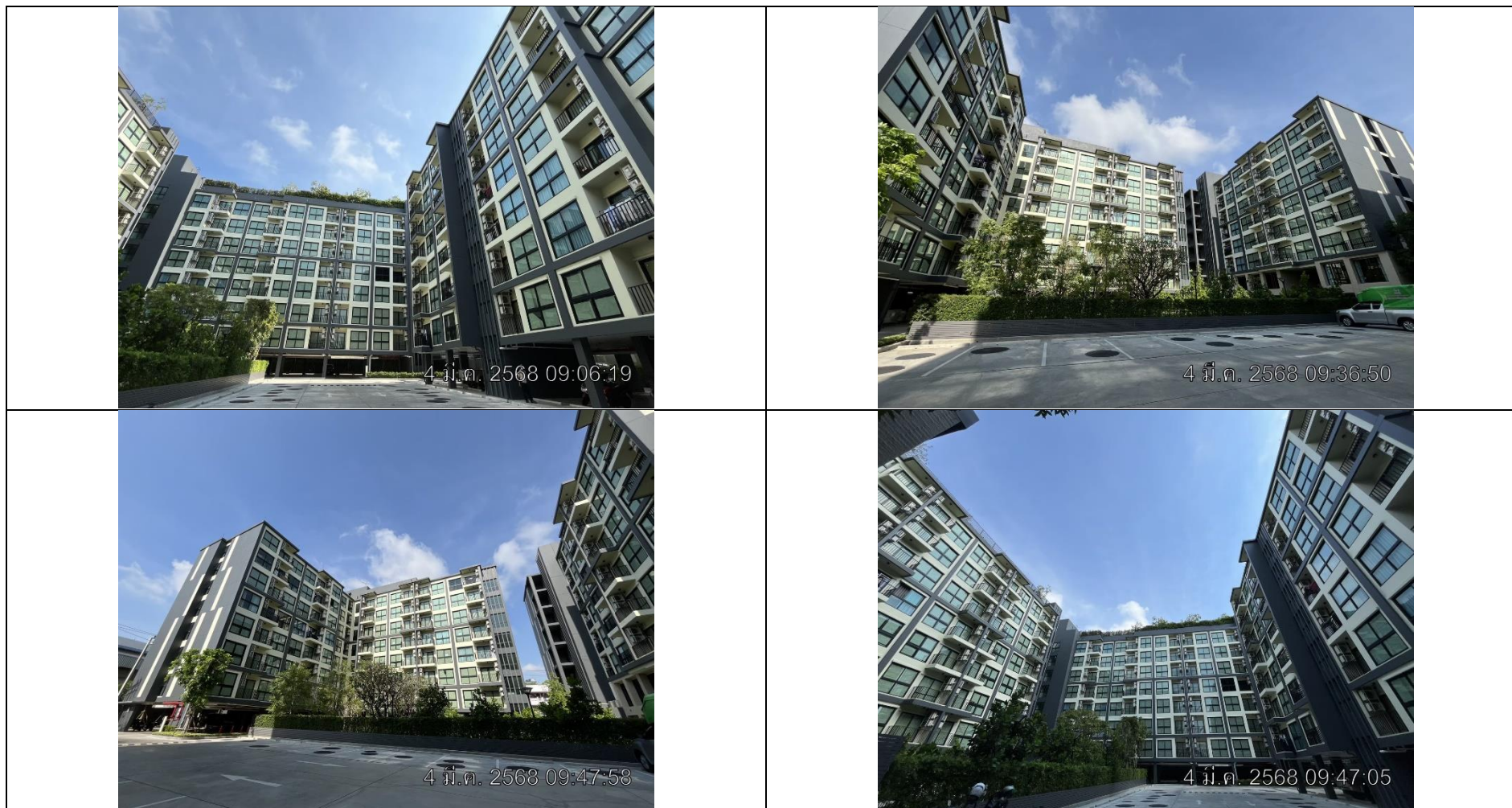
รูปที่ 1.3 สภาพโครงการในปัจจุบัน